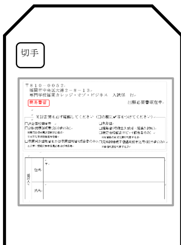
大きい封筒の場合